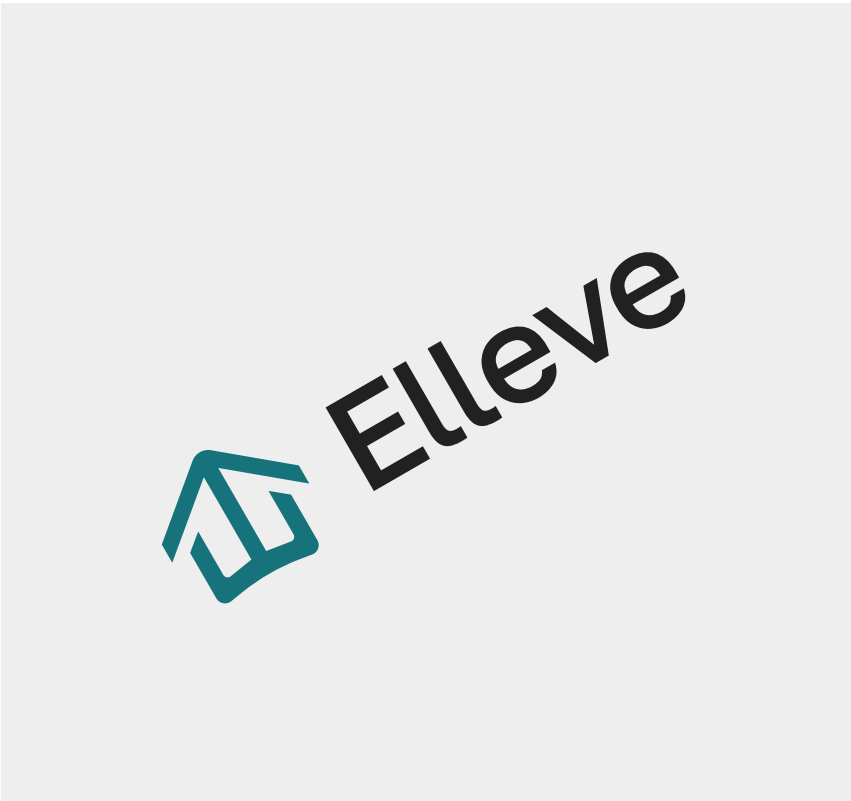
Não rotacione o logo