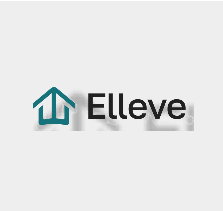
Não aplique sombras ou efeitos no logo