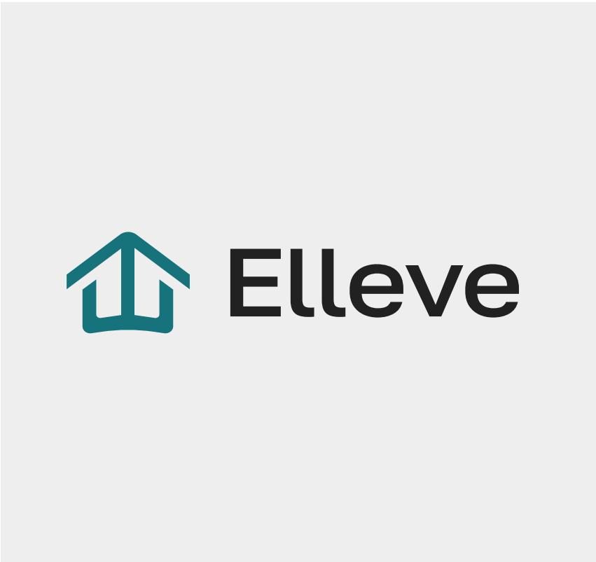
Não estique o logo

Ao lado estão alguns exemplos de usos que não devem ser utilizados.