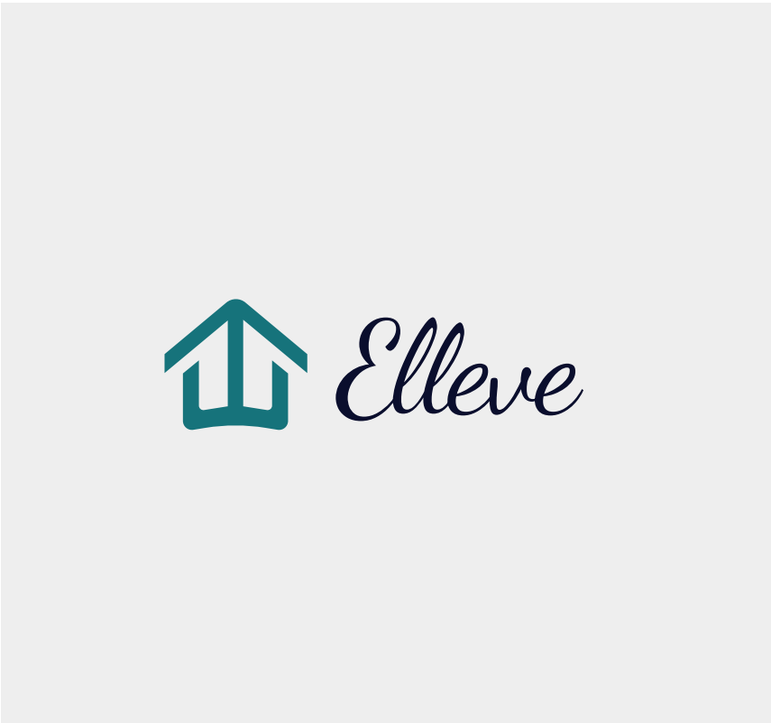
Não altere a tipografia do logo