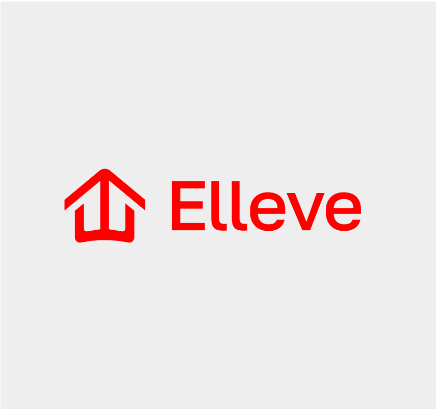
Não coloque o logo em cores inapropriadas