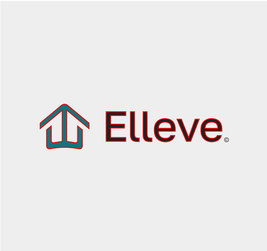
Não adicione contorno no logo